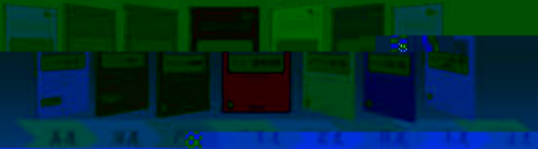
一体化课程教学设计 综合实训基地